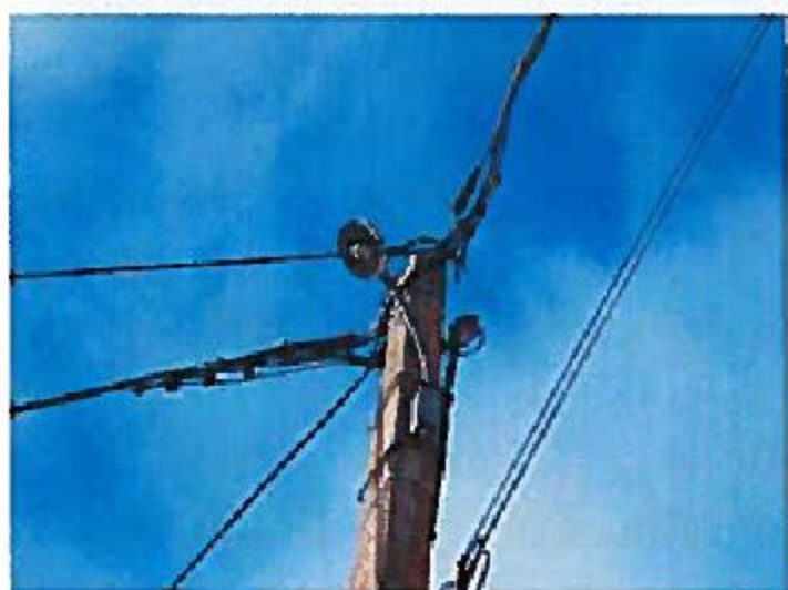
Lampe à supprimer

Cet investissement voté par le Conseil dans cette fin d'année sera réalisé courant, 2016.