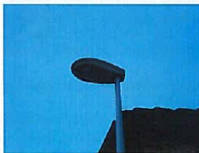
Lampe aux normes