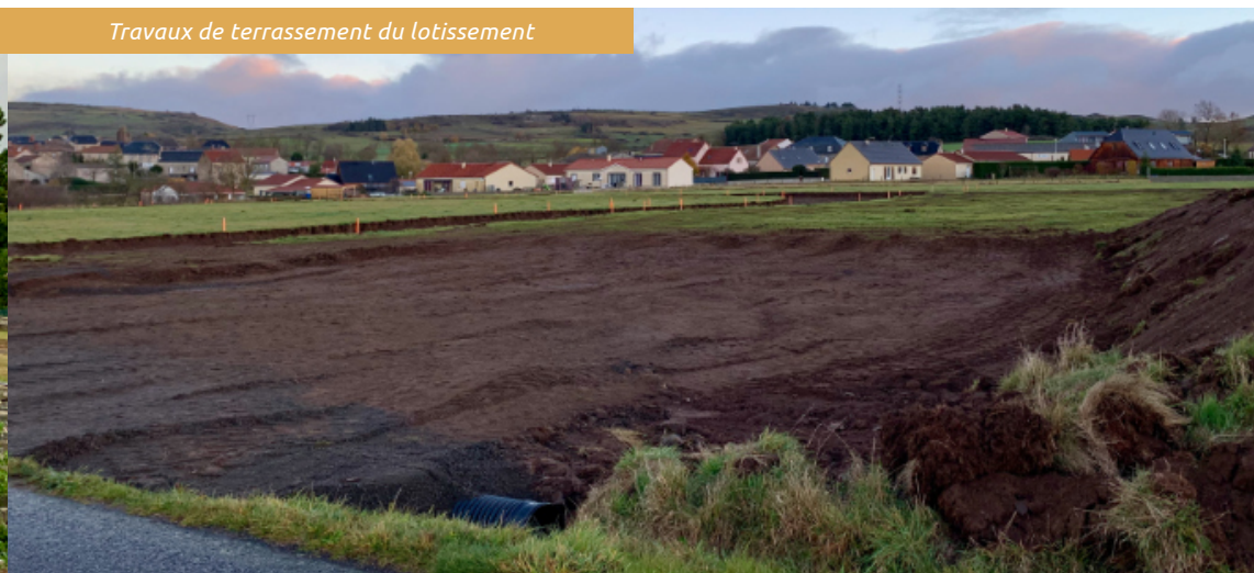
Travaux de terrassement du lotissement