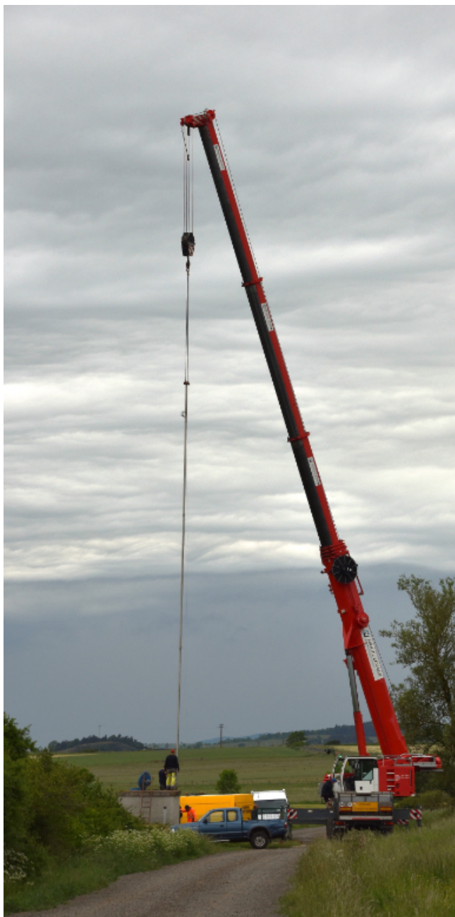
Changement de la pompe principale

espaces verts, comme le ramassage des feuilles et le nettoyage de la voirie.