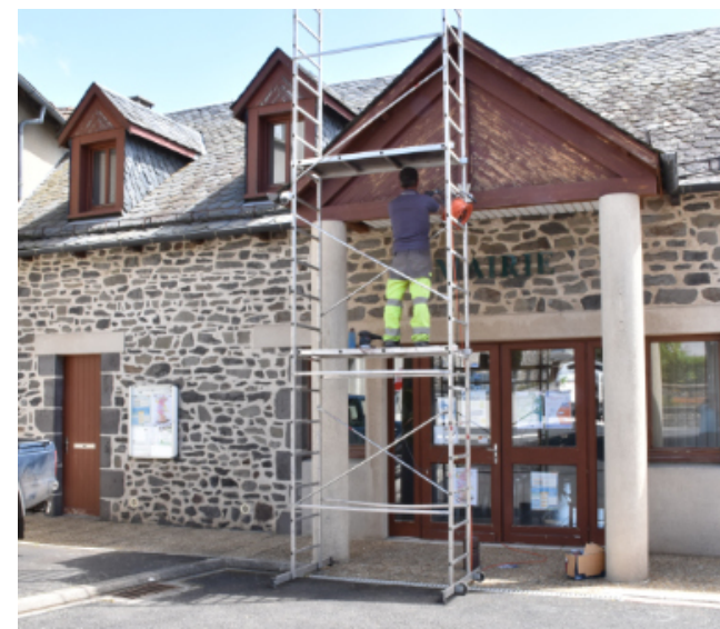
Peinture de la mairie

Soyons sûrs que nous pourrons compter sur nos agents communaux en 2023.