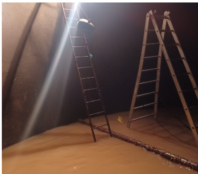
Nettoyage du château d'eau du bourg

Fin juin, les employés aidés par Franck ont repeint les menuiseries de la mairie. Aux yeux des talizatois la couleur choisie semble faire l'unanimité.