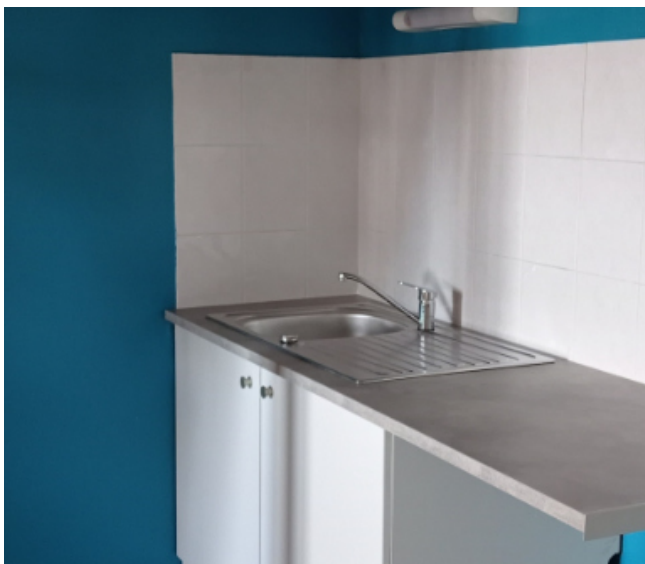
Remise en état d'un appartement

comme celles sur la route qui mène au stade de football, à la Chevade, à Frugères. Ce sont des centaines de mètres cubes qui ont ainsi été économisés cette année.