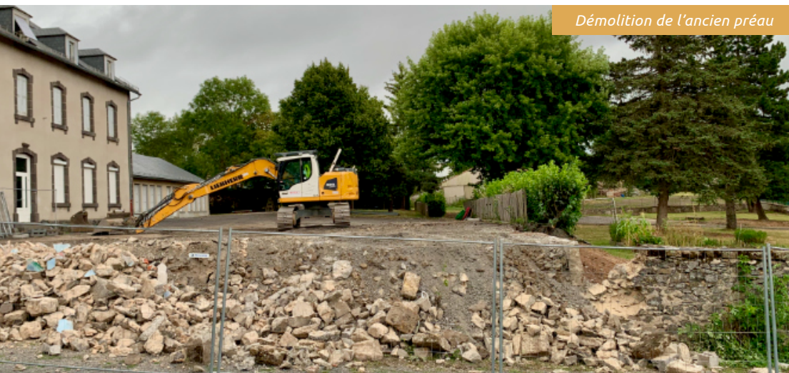
Démolition de l'ancien préau

Des lots seront disponibles à la vente au printemps 2023. Le coût de l'achat de la parcelle et de la viabilisation s'élève à 515000€ TTC. Le prix de vente des lots est fixé à 30 €/m 2 TTC. Il est dès à présent possible de réserver des lots auprès de la mairie. Un dossier de subvention a été déposé au titre de la DETR 2023.